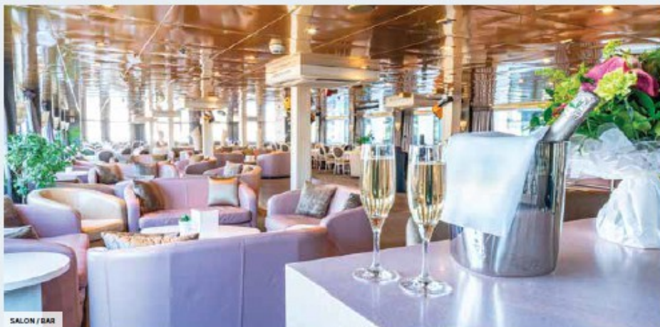
SALON / BAR